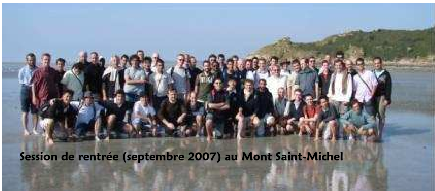
Session de rentrée (septembre 2007) au Mont Saint-Michel